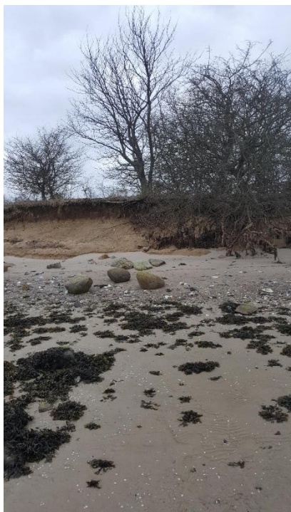
Strandstemning den 2. marts 2019